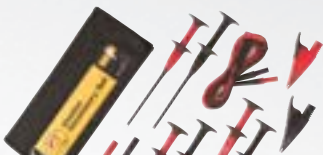
TLK225-1 SureGrip™ Satz Messleitungen für Streuspannungsadapter