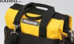
C550 Multimeter- und Zubehörtasche