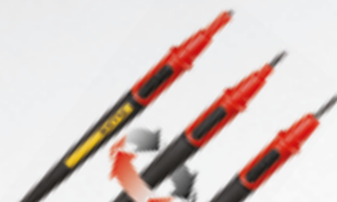
TL175 TwistGuard™ Messleitungen