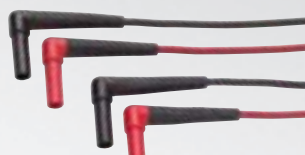
TL222 Satz SureGrip™ Silikon-Messleitungen