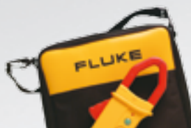
i410 Kit Gleich-/Wechselstromzange (400A) mit gepolsterter Tragetasche