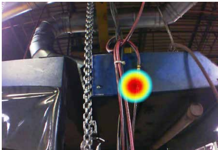
Obige Bilder wurden mit der Industrie-Schallkamera ii900 in einer industriellen Umgebung aufgenommen.